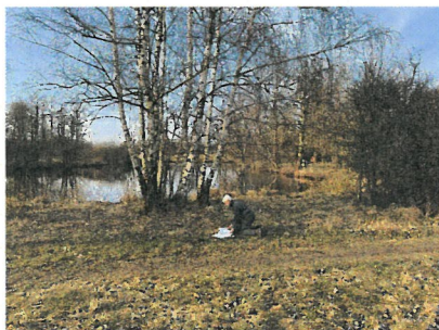
Ved sø nr. 53 kan der være en stenbunke ved siden af birken.

Stenbunkerne skal være synlige for driftspersonalet det slår græsset, så de kan køre udenom. Slåning af græs der vokset op rundt om stenbunkerne står frivilligegruppen for.